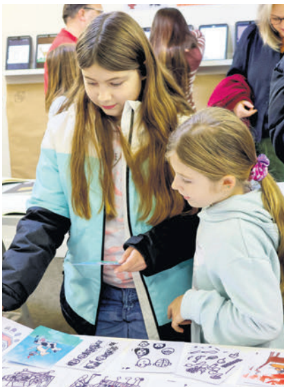
Die einzelnen Arbeiten werden begutachtet.